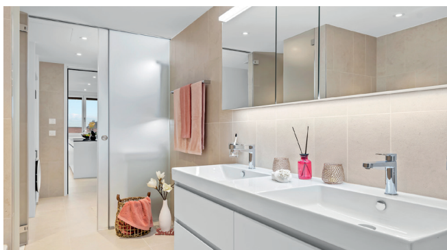
Bad/DU/WC 3.5-Zimmer-Wohnung 8.17