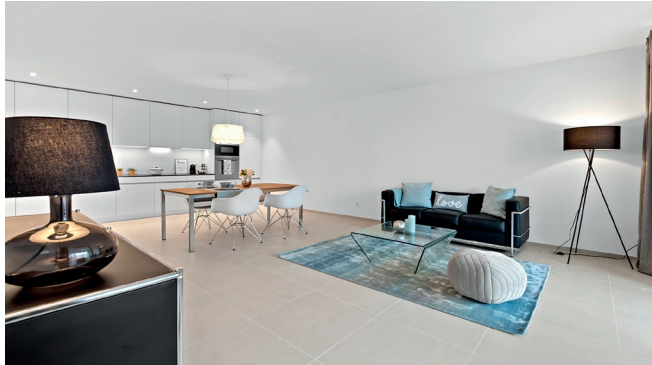
Wohn-/Essbereich 2.5-Zimmer-Wohnung 8.16