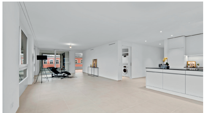
Wohn-/Essbereich 3.5-Zimmer-Wohnung 8.17