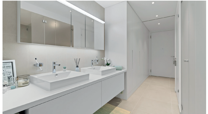
DU/WC 2.5-Zimmer-Wohnung 8.16