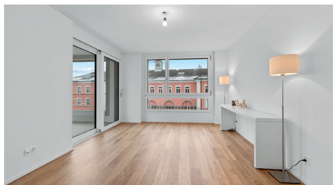
Schlafzimmer 3.5-Zimmer-Wohnung 8.17