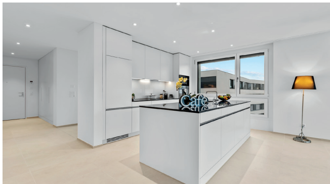
Küche 3.5-Zimmer-Wohnung 8.17