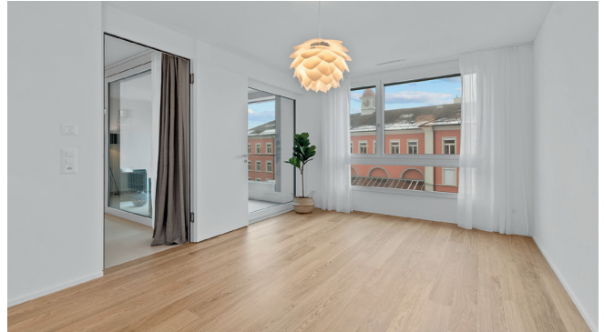
Schlafzimmer 2.5-Zimmer-Wohnung 8.16