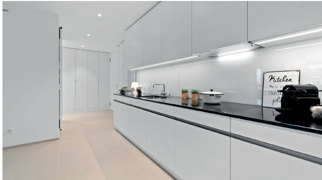
Küche 2.5-Zimmer-Wohnung 8.16